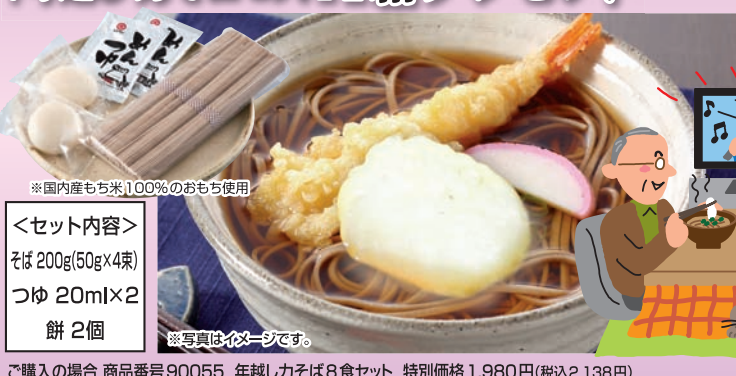
ご購入の場合 商品番号90055 年越し力そば8食セット 特別価格1,980円(税込2,138円)

国内産もち米100%のおもち付き 「年越し力そばセット」1箱プレゼント 先着1000名様限り