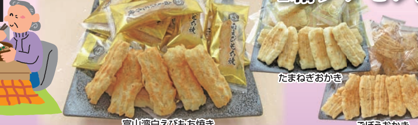
富山湾白えびもち焼き たまねぎおかき ごぼうおかき

「年越し力そばセット」1箱プラス 先着500名様限り 「たまねぎおかき(24枚入)」「ごぼうおかき(24枚入)」「富山湾白えびもち焼き(22枚入)」の中から 1箱プレゼント ※写真はイメージです。